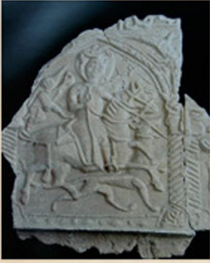
Kubadabad Sarayı Alçı Buluntuları

Hanikah mihrabında kalıpla oluşturulmuş alçı bordürler çini kaplı yüzey üzerine monte edilmiş ve mihrabın köşelikleri boş bırakılarak alttaki çini malzeme gösterilmiştir. Alçı ile çininin kullanımına Konya İç Karaaslan ve Sahip Ata Mescidinin mihraplarında da rastlanmaktadır.