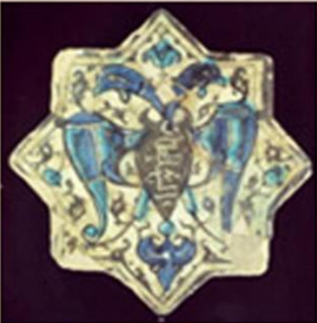
Kubadabad Sarayı Çini Buluntuları

Anadolu Selçuklu çini sanatının en önemli yeniliği olarak mozaik çini mihrapları söyleyebiliriz. Mihraplar mor, lacivert ve firuze çini parçalarla geometrik ve bitkisel desenlerle beraber neshi ve kufi yazılarla süslenmiştir. Çini mihraplar hemen tüm Selçuklu ibadethanelerinde kullanılmıştır. Konya Alâeddin Camii, Akşehir Ulu Camii, Konya Sırçalı Mescid çini mozaik mihrab geleneğinin kullanıldığı yapılara örnek verilebilir.