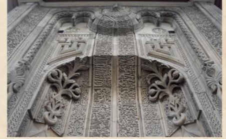
Konya İnce Minareli Medrese Taçkapı Detayı

Esas malzeme olan taşın yanında çini ile birlikte bitkisel, geometrik ve figüratif kompozisyonların kullanıldığı bir alçı sanatından söz edebilmekteyiz. Alçı yapılırken belirli bir kıvamda kalıba dökme ya da sonradan şekillendirme yöntemleri uygulanmıştır. Genelde dekoratif amaçlarla kullanılan malzemeyle ilgili özellikle Kubadabad Sarayı kazılarında yoğun buluntu ele geçirilmiştir. Kubadabad Sarayı kazı buluntuları içerisinde yer alan geometrik geçmelerle ve kuyruklu tavus kuşları ile bezenmiş alçı duvar rafı önemli bir üretdir. Bu sarayda uygulanmış çok miktarda alçı işçiliğinin bir diğer buluntu örneği ise atlı bir av sahnesinin işlendiği alçı panodur. Süslemede belirli bir motif programının kullanıldığını söyleyebiliriz. Tavus kuşu ya da avlanma sahnesi Ortaçağ Anadolu sembolizminin sıklıkla kullanılan motifleridir. Konya alçı süsleme programında yer alan bir diğer sahnede ise bağdaş kurmuş oturan ya da elinde bir balıkla ayakta duran figürler görülür. Bereket, iyi şans, cesaret ve tılsım gibi birçok gizli anlamlar taşıyan bu motiflerin kullanılması tesadüf olmasa gerek. Kubadabad Sarayı kazılarında bulunan çok sayıda yeşil, mavi, sarı filgözü camlarından birinin etrafında bulunan alçı kalıntı alçı ile camın aydınlatmada birlikte kullanıldığını gösteren bir buluntu olarak değerlendirilebilir.