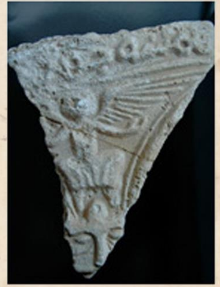
Kubadabad Sarayı Alçı Buluntuları

Anadolu insanını yoğuran fikri ve spiritüel akımlar da şekillenmiş; İslâm ülkelerine mensup şeyhler ve fakihler ile her birinin sözünü dinleyecek bir grup insan, göçebe ya da kentli bir araya gelmiş, ayrıca birçok tarikat da ortaya çıkmıştır. Halkın bu dinî ve mistik eğilimleri yanında, Sultanların, Vezirlerin, Melik ya da Emîrlerin de şair ve filozoflarla zenginleşen yüksek düzeyli bir kültür çevreleri vardı. Nitekim Rükneddin Süleyman Şah'ın filozof Şehâbeddîn Sühreverdi ile yakınlığı, I. Alâeddin Keykubad'ın Mevlâna ailesini Türkiye'ye getirterek onlara ülkenin gerçek sultanlarıymış gibi davrandığı, III. Keyhüsrev'in yetişmesinde Kadı Nurüddîn gibi bir bilim adamının büyük rol oynadığı, ünlü Selçuklu veziri Sahib İsfehanî'nin meclisinde Tebrizli Mevlâna Taceddin ile her ilimden konuşmalar yaptığı ve daha sonra Tebrizli hattat Veliyüddin ile saatlerce hat çalıştığı bilinir. Bunlara, I. İzzeddin Keykâvus'a, daha şehzâdeliği sırasında Malatya'da başlayan eğitiminde dolaylı olarak etkisi bulunan İbn'ul-Arabî'nin yazdığı nasihatnâme niteliğindeki mektubu da eklenebilir. 4