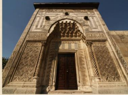
Konya Karatay Medresesi Taçkapı