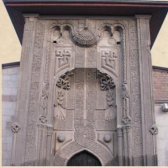
Konya İnce Minareli Medrese Taçkapı Orta Bölüm