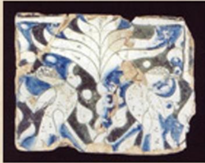
Kubadabad Sarayı Çini Buluntuları