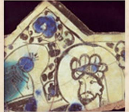
Kubadabad Sarayı Çini Buluntuları

Selçuklular mimari oluşumlarında zengin bir malzeme çeşitliliği oluşturmuşlardır. Taş mimari düzenlemede en önemli malzeme olmuştur. Surlardan, iç mekâna ve mezar taşlarına kadar Anadolu Selçuklu yaşam alanlarının her yerinde taş malzemeye rastlamaktayız. Anadolu'ya geldiklerinde zengin taş ocakları ve ustaları bulan Selçuklular bu tabloya kendi anlam dünyalarını katarak çok özel bir kompozisyon ortaya çıkarmışlar ve ışık gölge oyunları ile hareketli bir cephe kurgusu yaratmışlardır. Anadolu coğrafyasında taş süslemenin gelişiminde var olan atmosfer ile birlikte malzeme ve yetkin ustalık da önemli olmuştur.