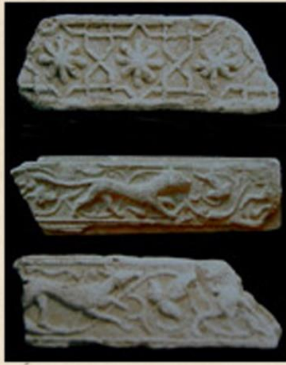
Konya Alaeddin Köşkü (Kılıçaslan) - Alçı Bordürler