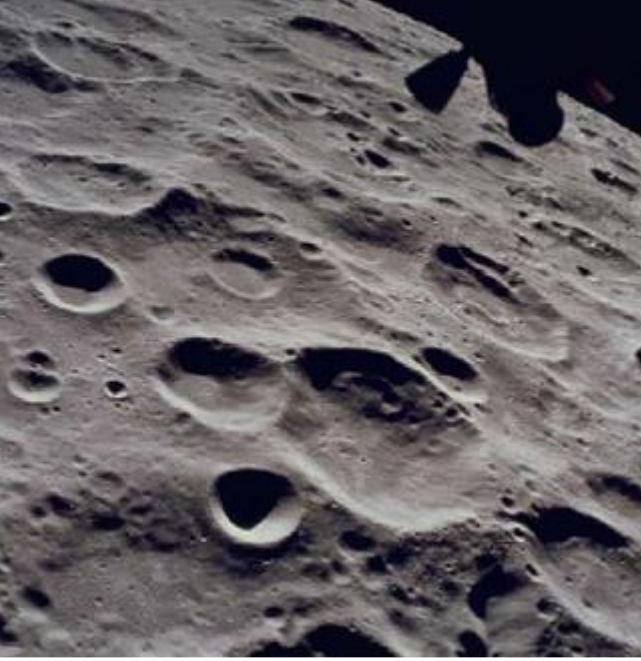
Ay'daki dağlar ve kraterler

Bu teoride Dünya çok hızlı döndüğü zamanlarda yüzeyinden tıpkı Ay gibi bir cisimi fırlattığı ve bu cismin daha sonraları küreselleşerek Ay'ı oluşturduğu düşünülmektedir. Şu anda geçerli olan teori ise dördüncü teoridir. Dünya 4.5 milyar yıl önce oluştuğunda diğer gezegenler oluşmaya devam etmekteydi. Dünya'nın oluşum sürecinin sonlarına doğru bu küçük gezegenlerden biri Dünya'ya çarpmıştır. Çarpışma sonrasında Dünya'dan bir yıkıntı dışı doğru saçılmaya başlamıştır. Bu kayalık yıkıntı Dünya'nın çevresinde bir yörüngeye oturmuş ve birleşmeye başlamıştır ve yavaş yavaş kütle çekim etkisiyle de kendi üzerine çökerek Ay'ı oluşturmaya başlamıştır. Ay'ın yüzeyi gittikçe soğuyarak günümüz haline ulaşmıştır.